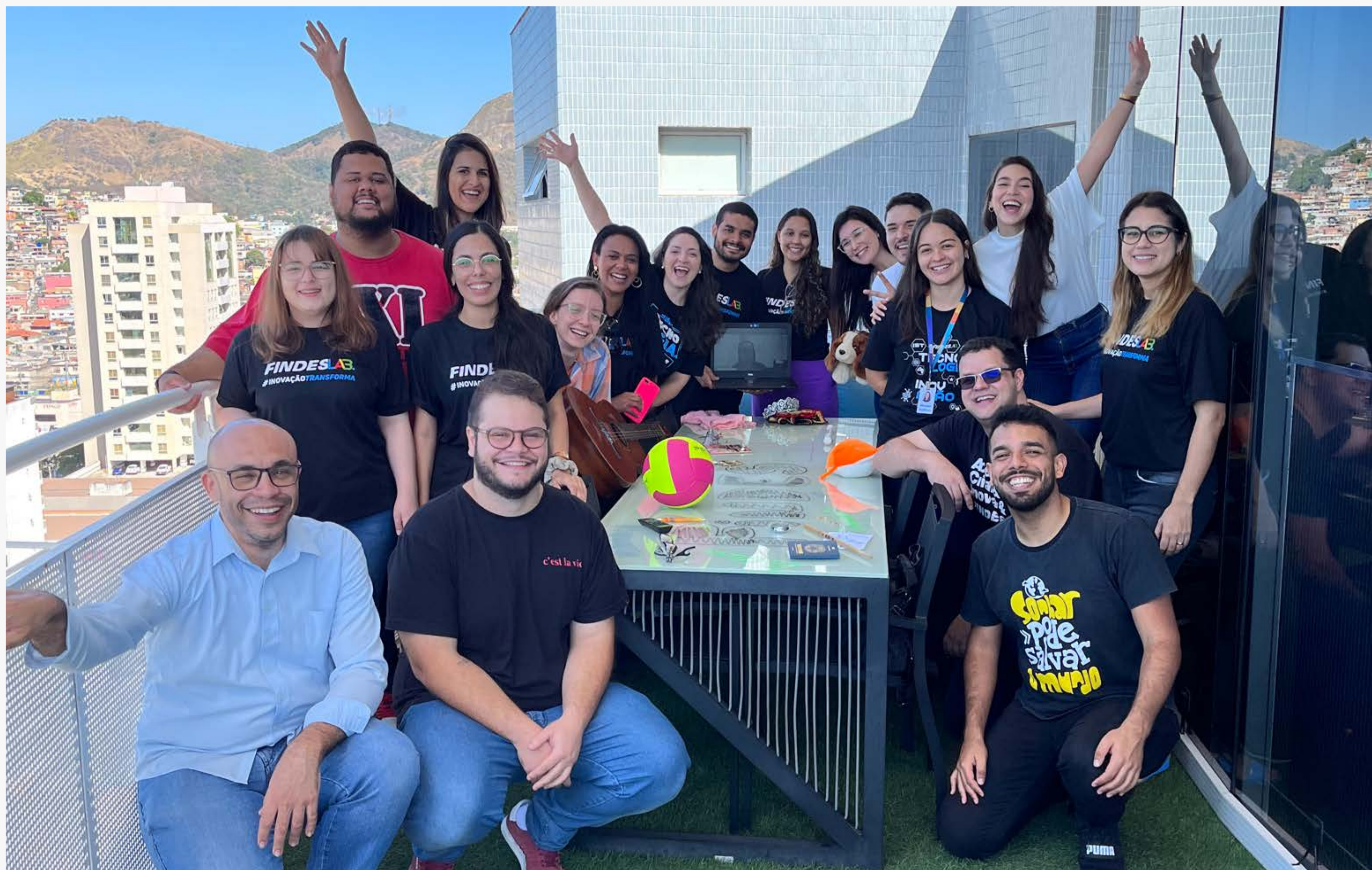
Varanday - dinâmica mensal para fortalecer as relações e conhecer cada vez mais cada integrante do time Findeslab

Você passa mais tempo no trabalho do que em casa? Convive mais com os colegas de trabalho do que com a própria família? Aposto que a maioria respondeu “sim”, né? E isso nos faz refletir sobre a importância de trabalharmos em um ambiente saudável e com a cultura bem definida.